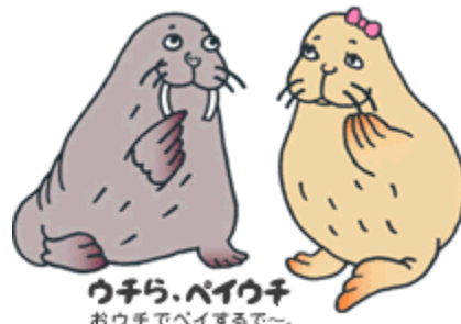
ウチら、ペイウチ おうちでペイするで〜。

キャンペーン期間中にペイジーを1回につき1,500円以上ご利用された方の中から抽選でプレゼントが当たります。 ※期間内であれば、お一人様何回でも、ペイジーをご利用の度にご応募が可能です。