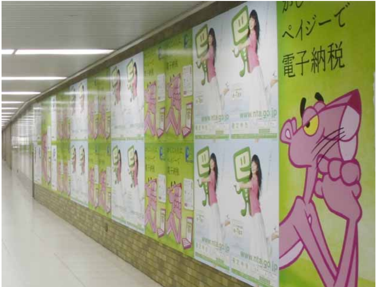
写真 ポスター掲示場所